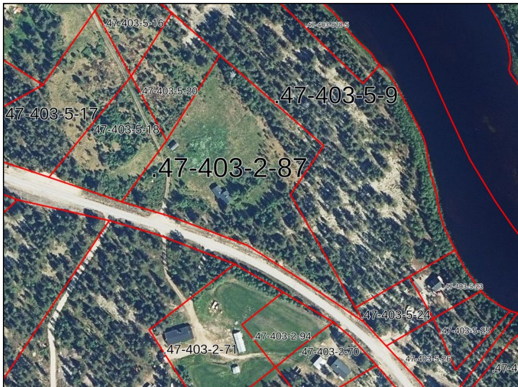
Suunnittelualueen kiinteistöjaotus Maanmittauslaitoksen ilmakuvakartalla.

Suunnittelualue sijaitsee kiinteistöllä 47-403-2-87 ja on yksityisomistuksessa.