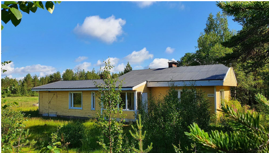
Suunnittelualueella sijaitseva omakotitalo.

Kiinteistöllä 47-403-2-87 on vuonna 1974 valmistunut omakotitalo sekä vanha lato, muutoin alue on rakentamatonta.