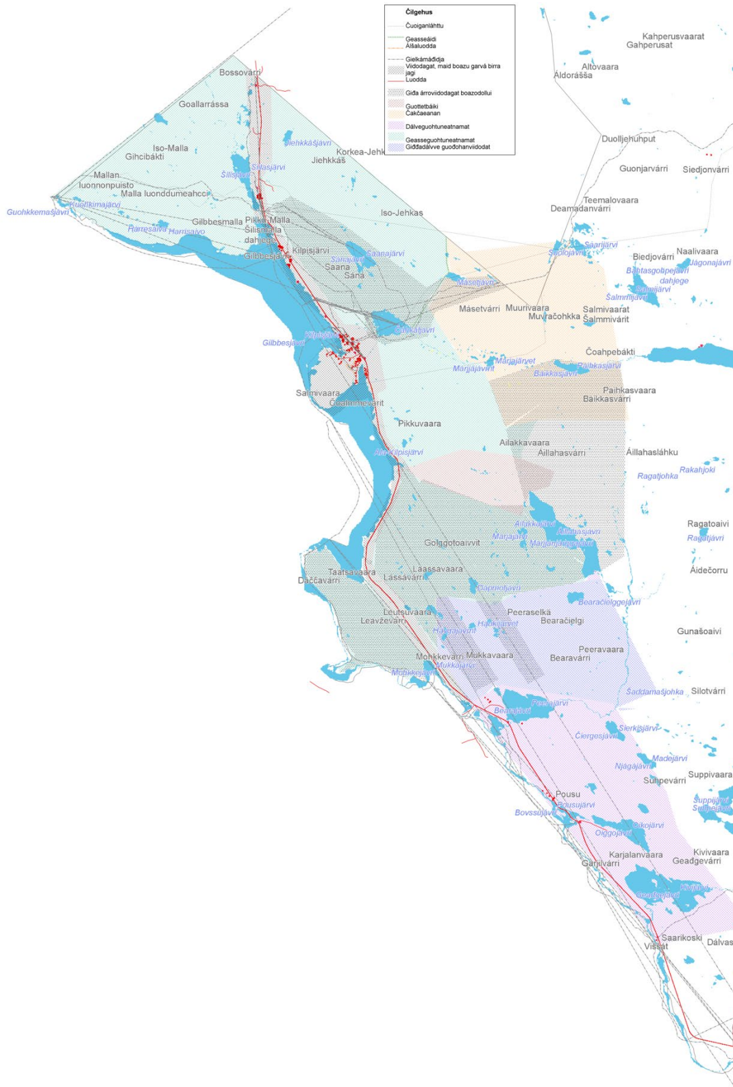
Govva 6 Gilbjesjávrri lávvaviidodaga guohtunmolsahuddan ja boazodoalu muosáhan árruviidodagat

Gártta gáldut: Informánttat; Geinnodagat: Lipas.fi bálvalus; Čázádat: Coraline eanangovččas, SYKE; Rájit ja nammarádjju: Enanmihtidanlágádus, báikedáhtavuodđu.