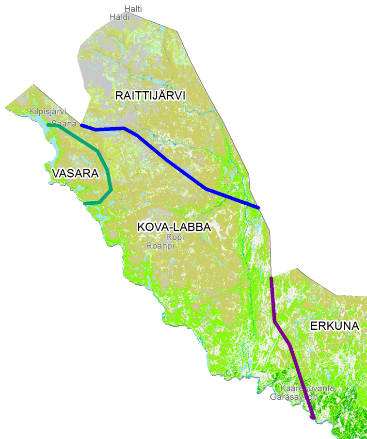
Govva 5 Giehtaruohtasa davvioasi guohtuneatnamiid válđojuhkáseapmi siiddaide 2000-logu álggus

Ođđahuksen ođđa eatnamiidda gáržžida bohccuid guohtuneatnamiid. Dát lasihivččii deattu bálgesa siste ja buktá sosiálalaš čuoimmaid, daningo guohtuneatnamat gáržot ja gilvu guohtuneatnamiin lassána bálgesa siste ja siiddaid gaskkas. Bálgesis leat eallit guđđojuvvon bohccuid mearri stuorimus lobálaš logu jalgii ja visot vejolaš guohtunressat leat anus. Juos guohtuneatnamat gáržot, dat sáhttá dárkkuhit, ahte boazobargiid mearri galgá unnut dehe boazobargomálla galgá iežáhuvvat ja lassibiebman galgá lasihuvvot. Oktage jearahallojuvvon olbmui ii áigon heaitit boazobarggu ja guovddášsignála lea, ahte turisma ja infrastruktuorra galget baicca válđit vuhtii boazodoalu ja sámi kultuvrra. Ballun lea, ahte lassánan árrima dihte ealut sáhttet mannat Norgga ja Ruoŋa beallái, gos daid lea váttis čohkket.