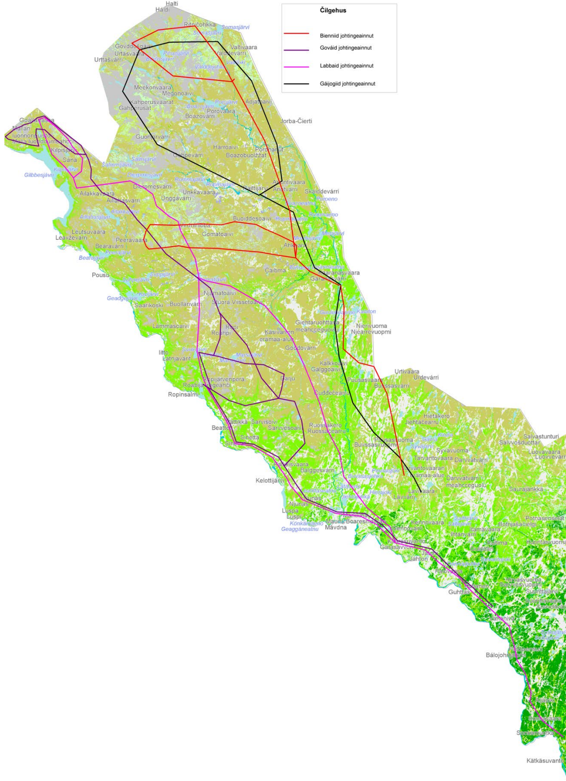
Govva 1 Giehtaruhttasu govllu johtingearinnut 1900-logu álgologijagiid rájes gitta 1960-logu beallemuddui